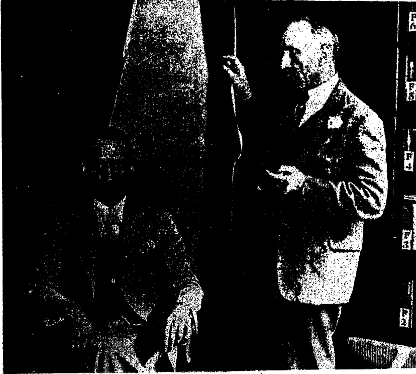
يبدو في الصورة (هاري برايس) الى اليمين مع /فرانك ديكور/ الوسيط الروحي الامريكي

وفي 19 أيار عام 1937 قام برايس المعروف عنه بأنه مؤسس المخبر الوطني البريطاني للبحث في الأمور الخارقة وبأنه الشخص المتمرس في المئات من المشاهدات للأشباح بنشر الإعلان التالي في جريدة (تايمز البريطانية) وهذا الإعلان كان كالتالي (إن الناس الذين لديهم وقت فراغ ويمتازون بالذكاء والحساسة والواقعية وعدم التميز مدعوون للانضمام لقائمة الراصدين في بيت القسيس (بورلي) ، ومن بين أكثر من مائتي شخص تقدموا لذلك اختار (برايس) أربعين منهم وهؤلاء الأشخاص الشجعان كان من بينهم أطباء ومهندسي عمارة وأعضاء للسلك الدبلوماسي والعلماء والعسكريين وعينة من المعتقدين واللامعتقدين وقد أمضى الجميع بعض الليالي غير المريحة في البيت الخالي بالبرد . حيث كانت غرفة واحدة